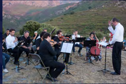
Aire à blé de Moncale (édition 2014)